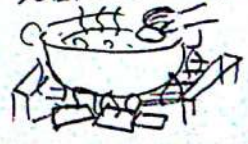
おいしいカレー でき上がり

★いためる、煮る、カレーを入れる いためるのも3年生、「頑張り! 大丈夫勇気を出して!」と上級生から声がかかると必死です。水を入れたら、前半、後半のおぼぎ順を決めて、炎を燃え上がらせるのに集中しました。そして湯気が立ち(ネー、湯気、たよと何度も言われたアビ「これ、煙」を経た)おぼが煮えたら先輩達を見習ってカレー投入は全員です。